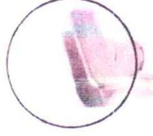
"U" plakalı pingo ayak